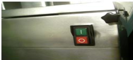
См.рис.1. Органы управления находятся на правой стороне корпуса (если смотреть на оборудование спереди): -зеленая кнопка «ПУСК» (I) включение оборудования; -красная кнопка «ОСТАНОВ» (O) выключение оборудования.