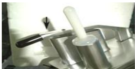
См.рис. 2 Оборудование оснащено двумя защитными микровыключателями (указаны стрелками). Микровыключатель на крышке отключает оборудование при открывании крышки для доступа к режущей пластине. Микровыключатель на рычаге-толкателе отключает оборудование при поднятии рычага-толкателя для загрузки продукта.