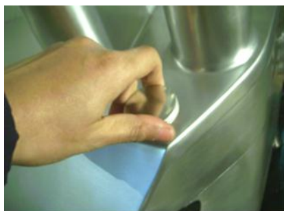
Открытие крышки (3)