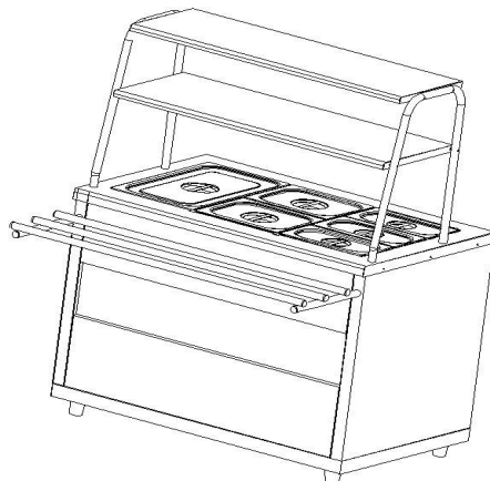
Рис.1 Общий вид мармита МЭП-2Б-П/ЛП, МЭП-2Б-П/ЛПЭ

Общий вид мармита представлен на рис. 1. В серии «Ли́ра-Профи» корпус мармита изготовлен из нержавеющей стали, в серии «Ли́ра-Профи Э́ко» отдельные элементы изготовлены из окрашенной оцинкованной стали. В столешницу мармита встроена прямоугольная паровая ванна с электронагревательными элементами.